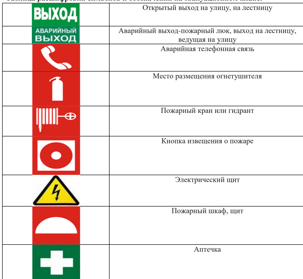
Таблица расшифровки символов и обозначений на эвакуационном плане:

6.12. На соревновательной площадке должна находиться аптечка первой помощи, укомплектованная изделиями медицинского назначения, необходимыми для оказания первой помощи.